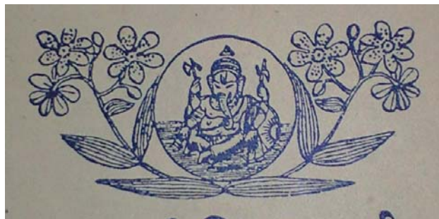
(上) HS-⑥ Gītagovindādarśa 表紙より