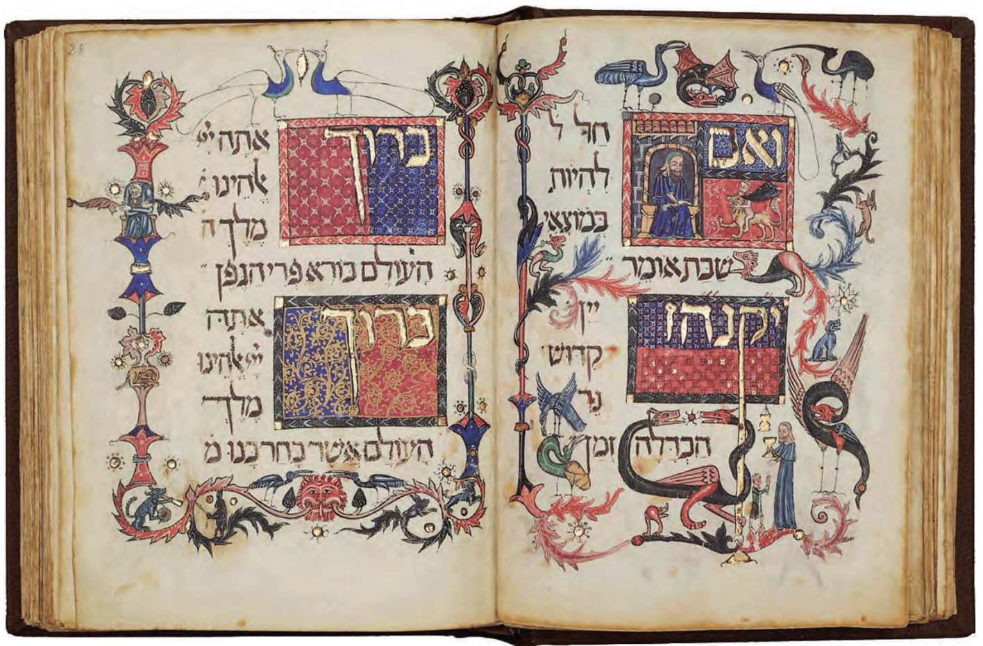
『バルセロナ・ハガダー』 ff. 25r-24v