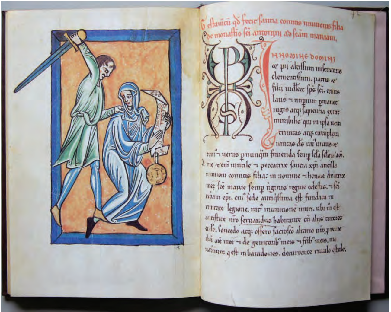
『レオン司教座聖堂寄進文書集成』 f. 41v 「甥に殺されるサンチャ女伯」