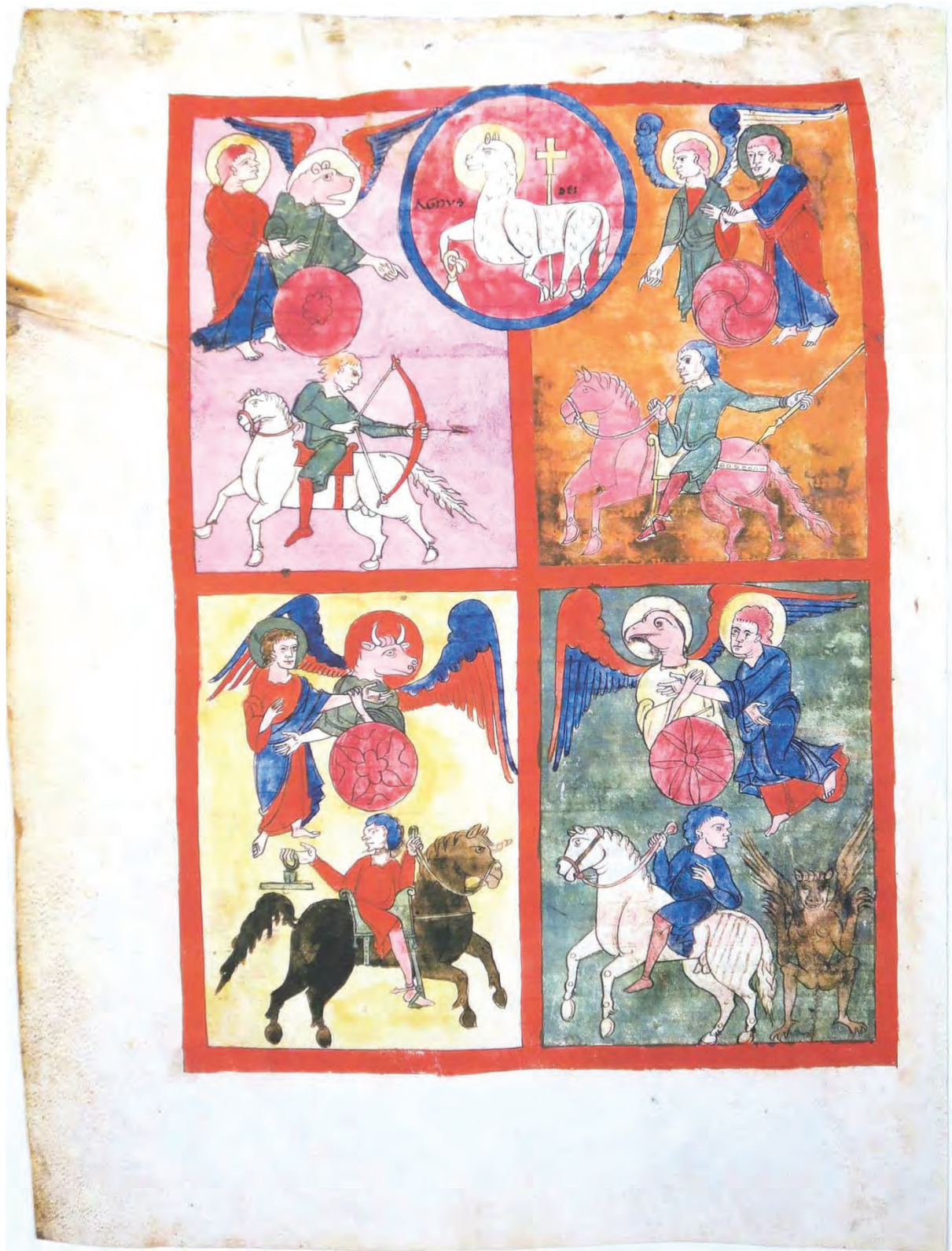
リエバナのベアトゥス『黙示録註解』 トリノ本 f.96v 「第1から第4の封印、四騎士」 (黙示録6:1-8)