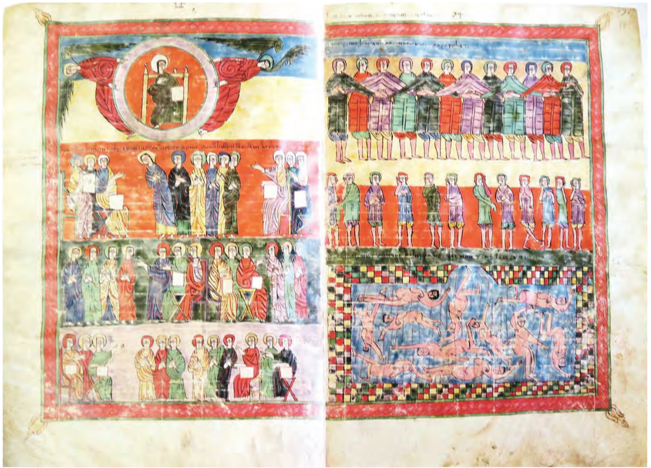
リエバナのベアトゥス『黙示録註解』ウルジェイ本 ff.184v-185 「最後の審判」 (黙示録20:11-15)